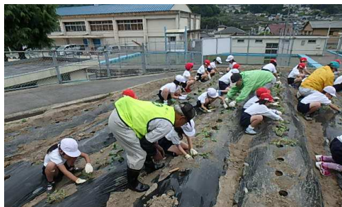
「中野ふれあい農園」農園育成事業