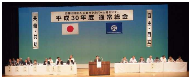
【平成30年度の通常総会】

なお、役員（理事）候補者については、広島商工会議所推薦の伊木理事から辞任届の提出がありましたので、広島商工会議所から新しい方の推薦をいただく予定となっています。