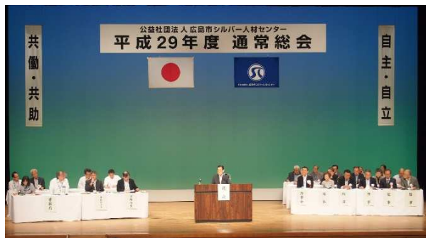
【平成29年度の通常総会】

なお、役員（理事・監事）候補者については、4月20日（金）から各区で4月26日（木）までブロック協議会（参加世話人合計79名）を行い、各区の候補者を選出いただき、5月11日（金）に開催しました理事及び監事候補者選考委員会（委員9名）で、各区の候補者を含めた「理事21名」「監事2名」の候補者を選考しました。