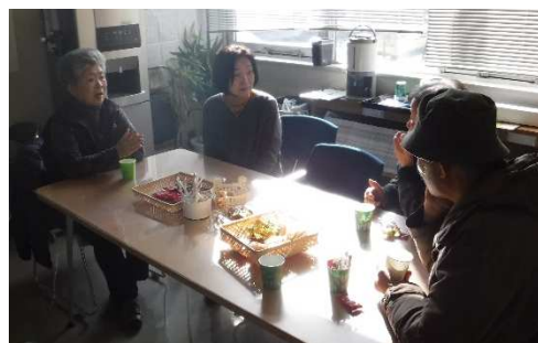
第1回カフェで交流中の会員のみなさん

2月の開催は、次のとおりです。開催時間中は、出入り自由となっていますので、お出かけのついでに「ちょっと寄ってみたい」という方もお気軽にお越しください。