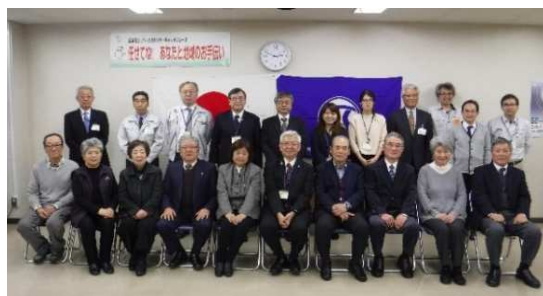
平成31年3月6日(水) 本部4階にて