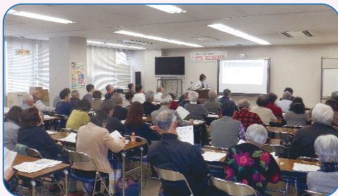
1月23日入会説明会（シルバー人材センター本部）

随時入会も受付けておりますので、入会をお考えの方がいらっしゃいましたら、ご紹介ください。ご連絡は各事務所へ。