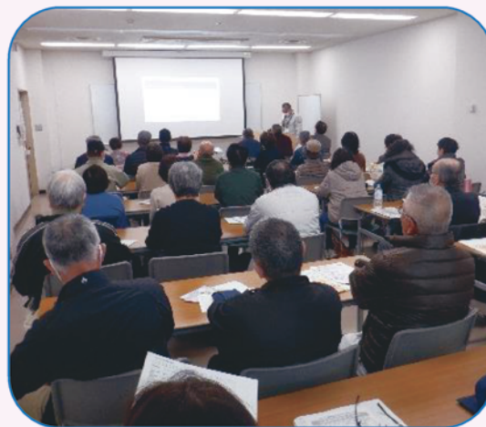
2月26日入会説明会 （安佐南区民文化センター）