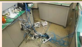
ほこりまみれの机の裏