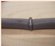
固定具の打ち付け過ぎ