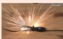
束ねた電気コード