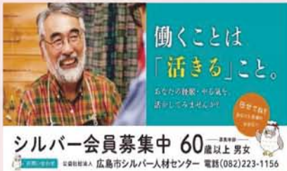
JR新白島駅構内 (拡大)