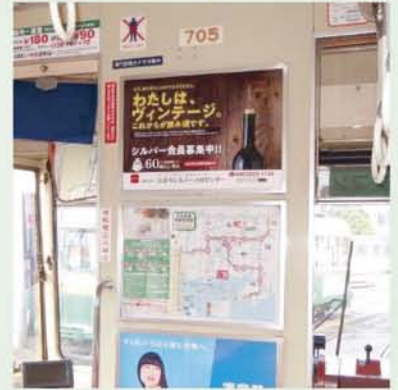
広島電鉄市内電車内