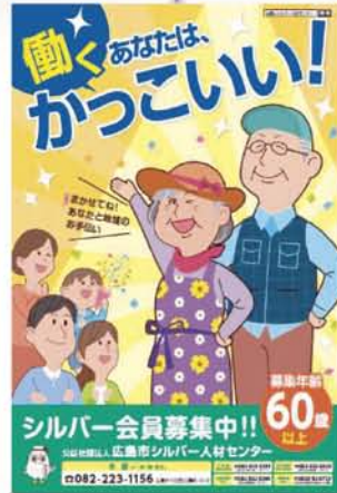
会員募集ポスター