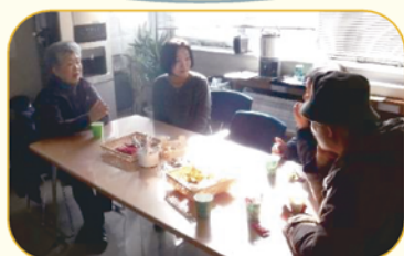
カフェで交流中の会員の皆さん