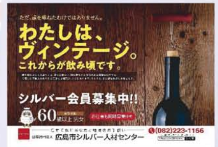
広島電鉄市内電車内 (拡大)

シルバー事業をより多くの方々に知っていただくため、PR 活動を実施中です。ぜひご覧ください。