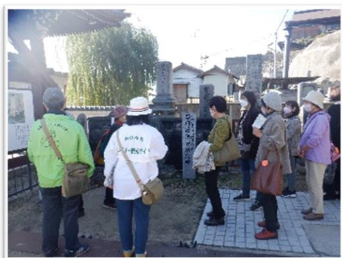
観光ガイドによる説明

現地では、尾道市のシルバー会員による「観光ガイド」を実際に体験し、意見交換しました。参加者の皆さんは、大変勉強になり、有意義な一日を過ごせたと感想を述べられました。