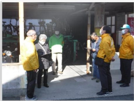
安芸中野駅前自転車等駐車場

今年7月に続き、理事長及び安全・適正就業部会の委員等が2班に分かれて就業現場4か所を巡回しました。今年度は事故件数が多く、安全な就業や健康管理に努めるよう注意を呼びかけました。