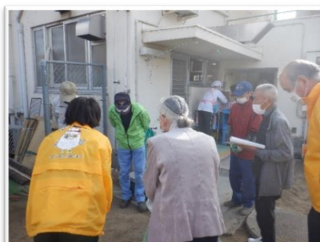
広島市立川内保育園