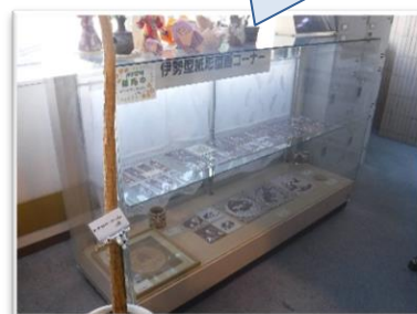
伊勢型紙販売コーナー