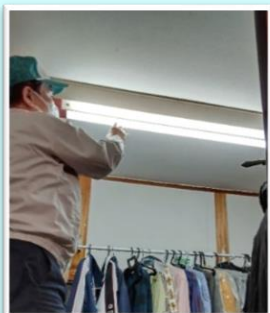
就業の様子(蛍光灯交換)