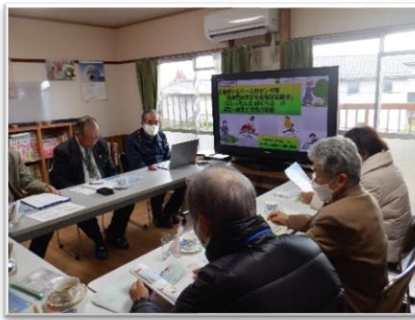
びしゃもん台絆くらぶ