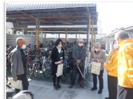
不動院駅前自転車等駐車場