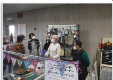
衣類リフォームコーナー