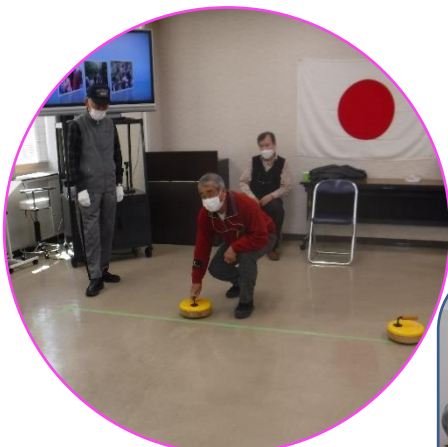
フロアカーリング