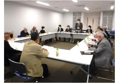
区老連連合会長・事務局長会議

4月24日（月）、区老人クラブ連合会長・事務局長会議へ参加し、今年度も引き続き会報への記事掲載やチラシ配付、会議への出席などで連携し、協力していただくよう依頼しました。