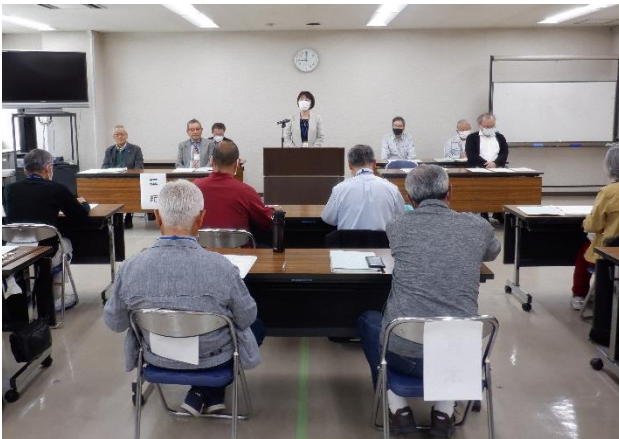
開 校 式

植木スクールでは、樹木の名前、道具の使い方など、植木せん定の技術的な面はもちろんのこと、仕事に対する心構え、施主との接し方、安全確保など、スクール修了後に剪定業務に就業するために必要なあらゆることを習得していただく予定です。