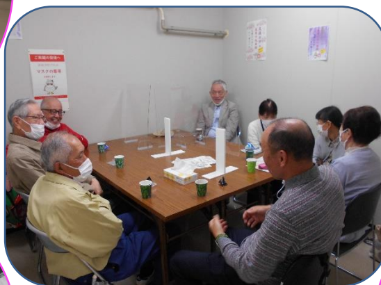
佐伯支部交流カフェ