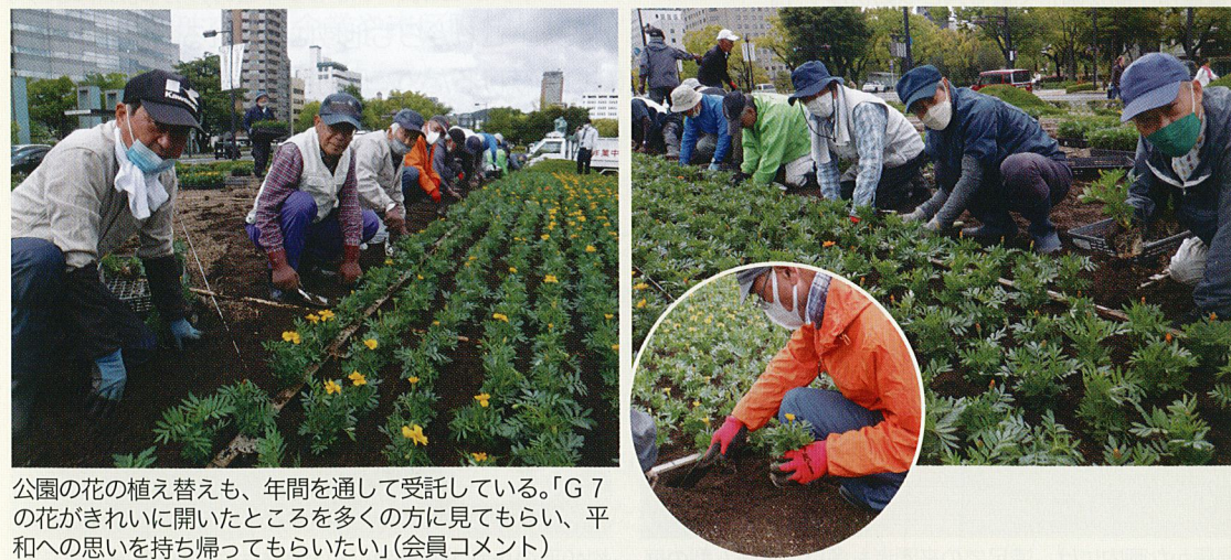
公園の花の植え替えも、年間を通して受託している。「G7の花がきれいに開いたところを多くの方に見てもらい、平和への思いを持ち帰ってもらいたい」(会員コメント)