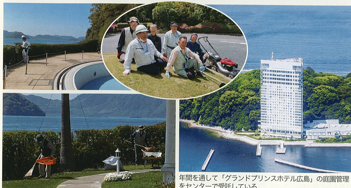
年間を通して「グランドプリンスホテル広島」の庭園管理をセンターで受託している