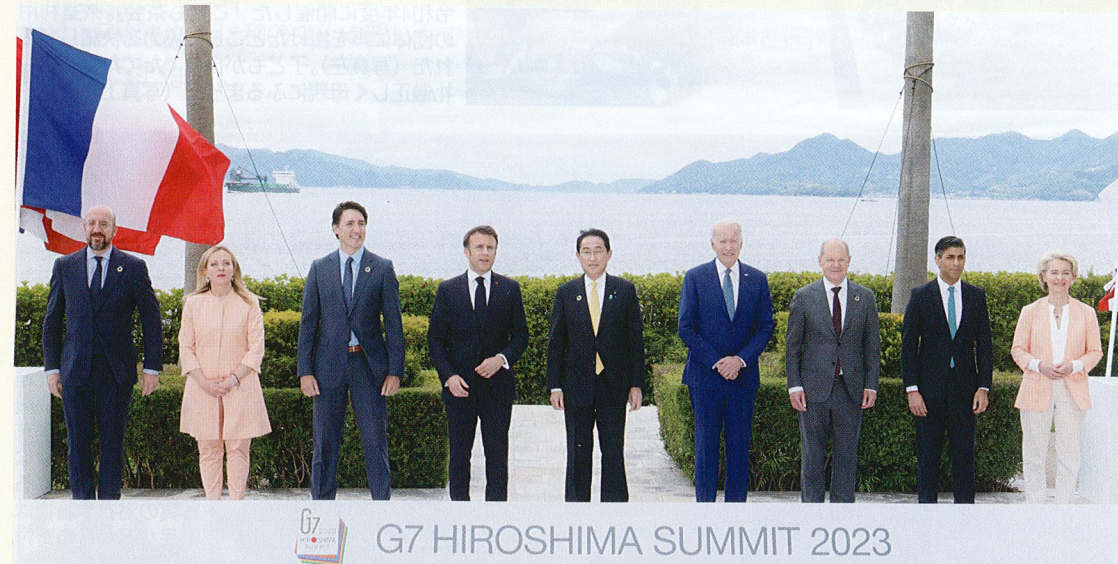
G7 首脳プリンスホテル集合写真。瀬戸内海を背景に並ぶG7 各国首脳。広島市SCでは、サミット会場となった「グランドプリンスホテル広島」の庭園管理を任されており、後ろの植え込みは開始前に会員が剪定を行った

広島市SCでは、G7サミットが円滑に開催できるよう、会員、事務局職員が一丸となって、剪定や花の植え付けなどの業務、ボランティア清掃を通して、応援の取り組みを展開するとともに、平和関連施設での案内などで「ヒロシマの思い、の発信に努め、おもてなしの気運醸成に貢献しました。