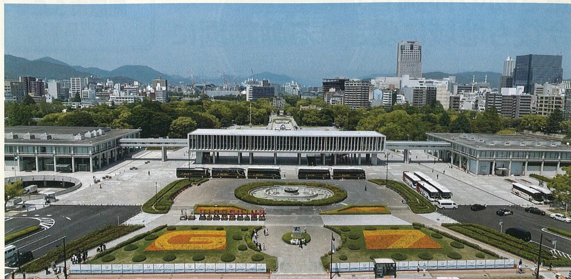
各国首脳が献花を行った原爆死没者慰霊碑のある平和記念公園南側の花壇で、G7 歓迎の花壇作り。約1万株のオレンジと黄色のマリーゴールドの花苗を、会員たちの見事なチームワークで植え付けて、「G」と「7」の花文字を鮮やかに浮かび上がらせた