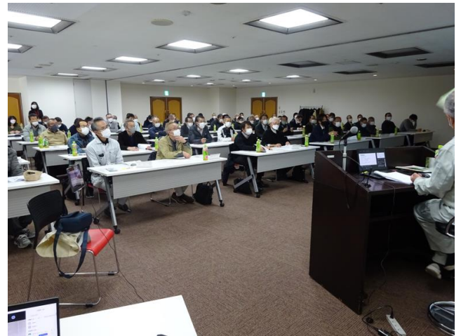
チェーンソー研修会：説明を聞く安全就業推進員及び会員代表