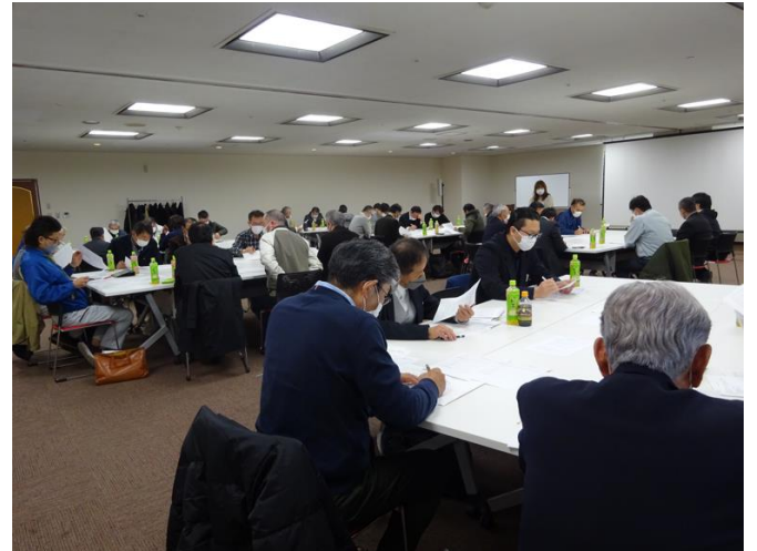
安全就業推進員研修（グループ討議をする各センターの安全就業推進員）