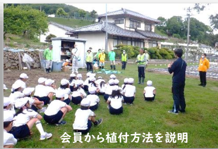
会員から植付方法を説明