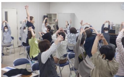
いきいきストレッチ教室