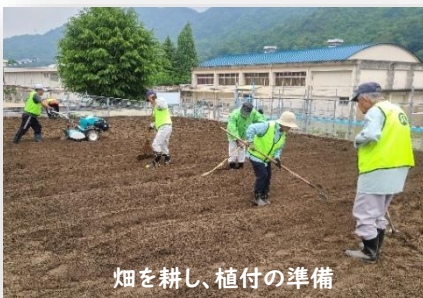
畑を耕し、植付の準備