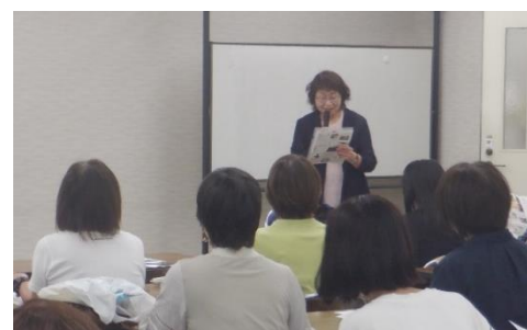
垣内会員による体験談