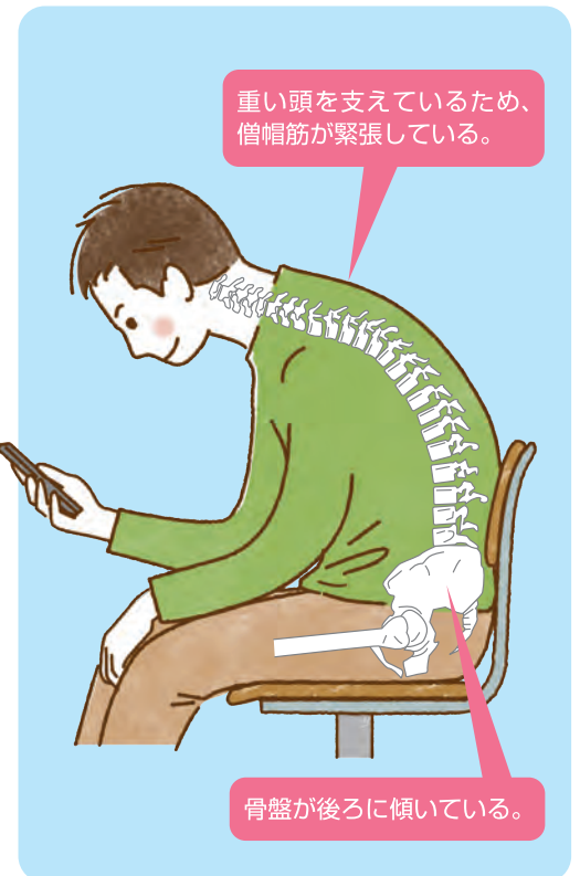
図1 悪い姿勢(極端なうつむき姿勢) 背中の表層にある筋肉(僧帽筋)の緊張は肩こりの原因に、骨盤の傾きは腰痛の原因になる。