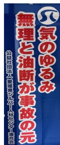
※安全就業スローガン （啓発用のぼり）