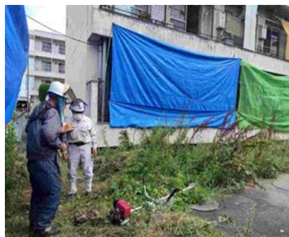
※就業パトロールの状況