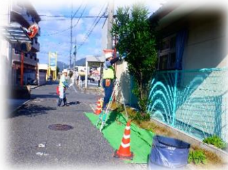
保育園剪定(安佐北区)

昨年度、実際に事故が発生した箇所等を見学しました。作業する足元が不安定な場所もあり、会員は細心の注意を払って就業しています。