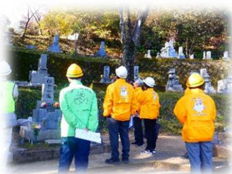
三滝墓園清掃(西区)

11月10日(月)、安全・適正就業部会で就業現場2か所を巡回し、安全な就業と健康管理に努めるよう注意を呼びかけました。